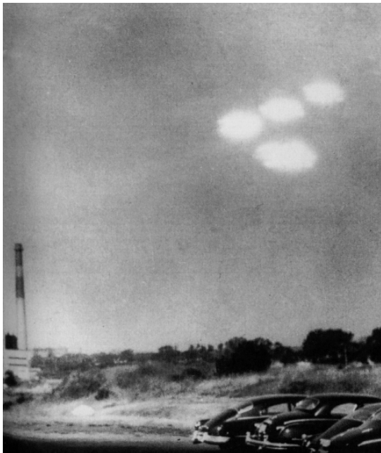
(Gralsscheiben-Formation über Salem, Massachusetts, USA, 16. 7. 1952)

Hier sind schon typische Details erkennbar: Scheibenform, Formationsflug und das Interesse für militärisch sensible Anlagen. Zur selben Zeit tauchten die Foo-Fighter über Europa auf, wenn auch nur sporadisch. Massiv traten sie erst 1946 auf, allerdings unter anderem Namen.