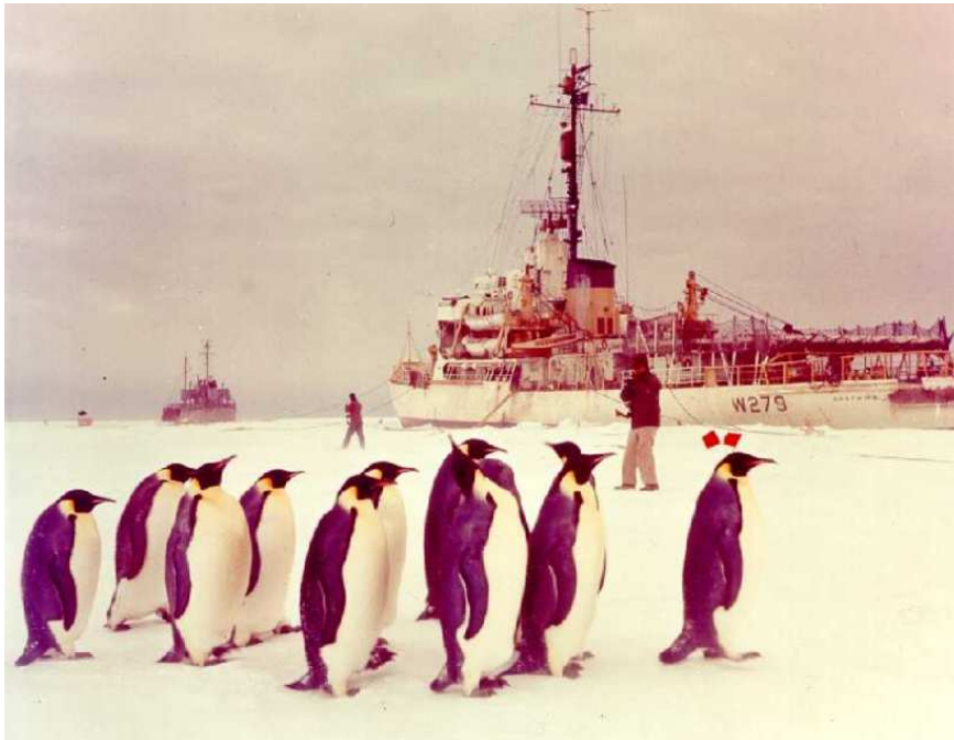
(Operation Deepfreeze 7 , 1955/56)

(Johannes Jürgenson 5 ;) Nachdem der erste Antarktis-Schock 6 überwunden war und man die feindlichen Fluggeräte gründlich studiert hatte, wagte man 1955/56 einen zweiten Versuch, die Antarktis zu erobern. Die Amerikaner starteten die „ Operation Deepfreeze “ (Tiefkühlen), wieder unter dem bewährten Kommando von Admiral Byrd , wieder im Ross-Meer. Wieder war es eine „wissenschaftliche Expedition“ und wieder brauchte man zum Schutz der „Wissenschaftler“ vor Pinguinen und anderen Gefahren über 3.000 Mann, 12 Schiffe, 200 Flugzeuge und 300 Fahrzeuge, darunter Panzerfahrzeuge. Diesmal kamen die Sowjets zu Hilfe (mitten im ‚Kalten Krieg‘!), und zwar mit 500 Mann und einem Geschwader von Flugzeugen. Die folgende Saison 1956/57 wurde das „Internationale Geophysikalische Jahr“ genannt, um der Aktion einen harmlosen Namen zu geben.