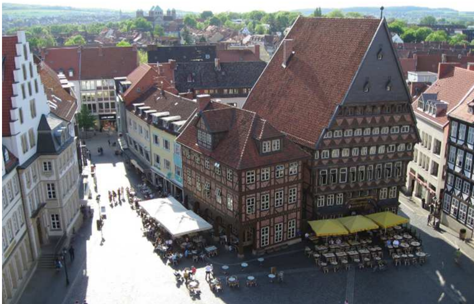
(Hildesheim – Altstadt. Im Hintergrund die Michaeliskirche)

Rudolf Steiner hat von einer Stadt im nördlichen Mitteleuropa gesprochen, die ein großes Ausstrahlungszentrum für das Mittelalter gewesen ist, und das war Hildesheim 2 .