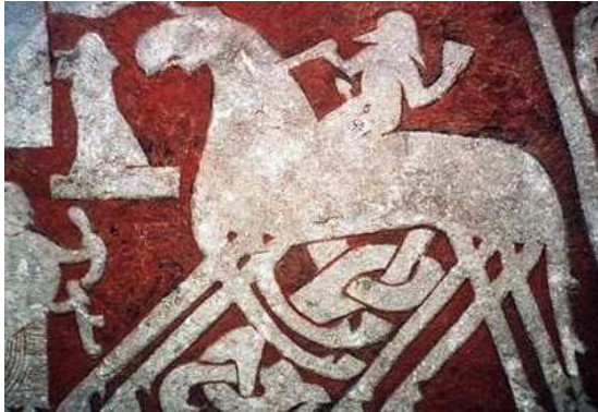
(Odin auf Sleipnir, Bilderstein aus Gotland)