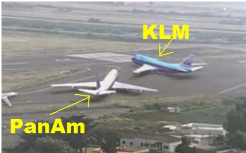
(Ausschnitt und Vergrößerung des obigen Bildes)

Zu dem Bild: Während dem Auftanken ... verließ die PanAm-Besatzung das Cockpit und überprüfte den vorhandenen Freiraum zwischen den beiden Flugzeugen, um im Fall einer Starterlaubnis an der KLM-Maschine vorbeizurollen. Die Distanz reichte hierfür aber nicht aus 9 .