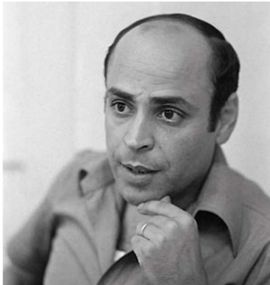
(Abu Nidal [1937-2002])