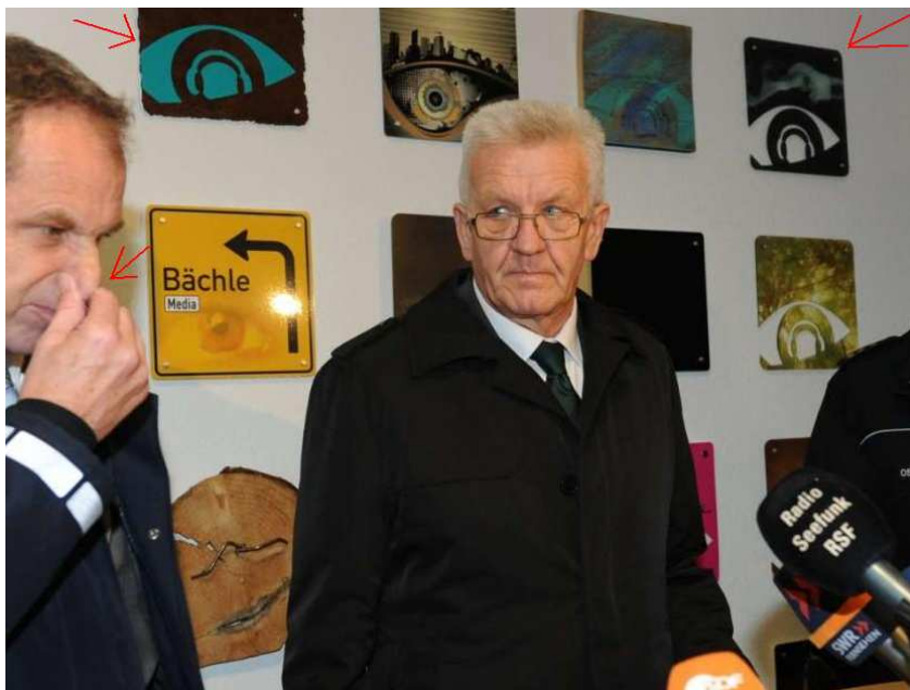
(Der baden-württembergische Innenminister Reinhold Gall (li.) und Ministerpräsident Winfried Kretschmann (Mitte) während der Pressekonferenz 10 . Man achte auf den „Einaugen“-Hintergrund und die Geste von Reinhold Gall, die wohl [im Bilde] ausdrücken soll: „Hier stinkt ...“)

Warum wird nirgends ein Plan der gesamten Werkstatt mit der genauen Stelle des „Brand“-Herdes aufgezeigt 9 ? (Frage 16)