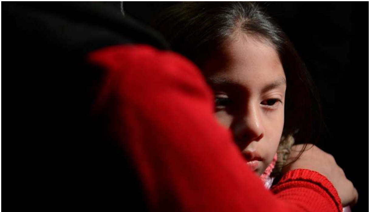
(Ein betroffenes Kind von Newtown)