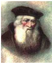
(Jakob ben Ascher [ca. 1269 in Köln – ca. 1343 in Toledo, s.u.]

Insbesondere darf ein jüdischer Arzt nichtjüdische Patienten nicht behandeln . MAIMONIDES 7 – selbst ein berühmter Arzt – drückt sich hier sehr deutlich aus; in einer anderen Textpassage 8 wiederholt er den Unterschied zwischen „deinem Nächsten“ und einem NichtJuden und kommt zu der Schlußfolgerung: „und hieraus lernt ihr, daß es verboten ist, einen NichtJuden sogar gegen Bezahlung zu heilen ...“