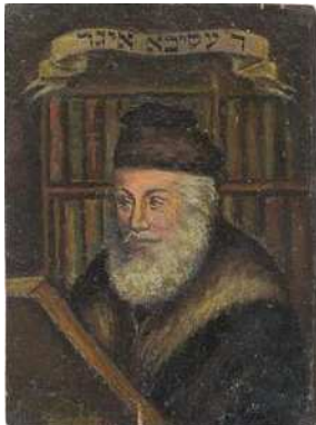
(Akiva Eger [Eisenstadt, 1761 – Poznan, 1837, s.o.] Talmud-Gelehrter )

Somit, da es eine sehr geringe Chance gibt, daß irgendeiner der Passagiere jüdisch ist, muß es ihnen erlaubt sein zu ertrinken . 13