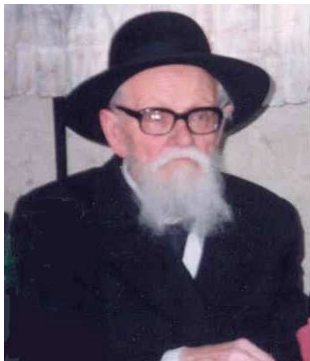
(Rabbiner Eliezer Yehuda Waldenberg [Jerusalem 1915 – 2006 Jerusalem])

Alles dies ist keineswegs ein überholtes Ergebnis. Die aller neueste halachische 14 Stellungnahme zu diesen Angelegenheiten ist in einem vor kurzem erschienenen, knapp gehaltenen und autoritativen Buch enthalten, das in englischer Sprache unter dem Titel „ Jewish Medical Law “ 15 [Jüdisches Ärzterecht] veröffentlicht wurde. Dieses Buch, welches das Impressum der renommierten israelischen Stiftung „ Mossad Harav Kook “ (s.u.) trägt, basiert auf den Responsa des Rabbiners Eliezer YEHUDA WALDENBERG , Oberrichter am Rabbinischen Bezirksgericht in Jerusalem. Einige Textpassagen dieser Arbeit verdienen eine besondere Erwähnung.