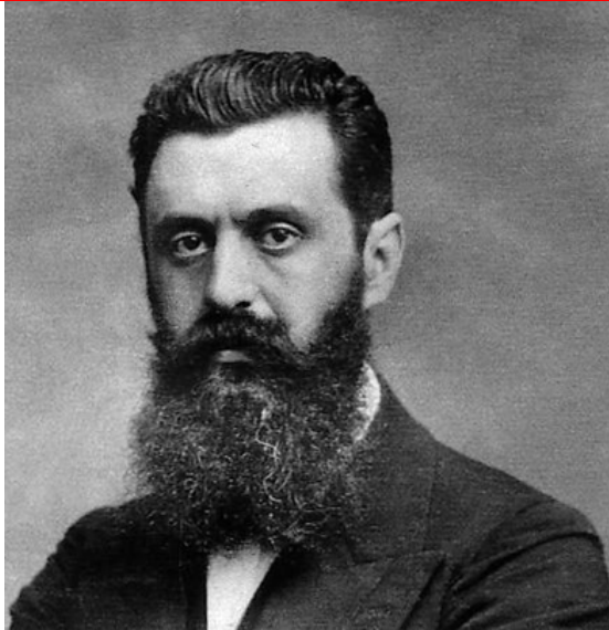
Theodor Herzl (Ungarn 1860-1904 Österreich)