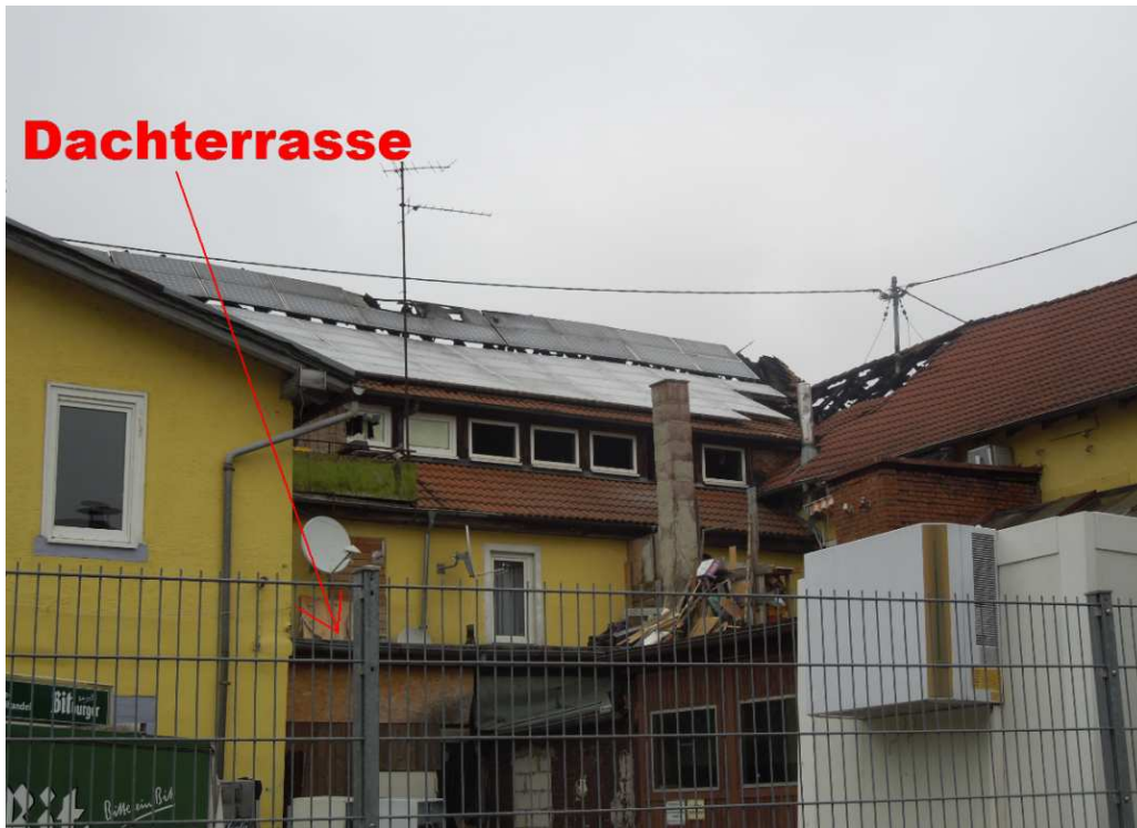
(Dachterrasse des rückwärtigen linken Teil des Hauses [vgl.o.] )

Im Gespräch zeigte sich die ortsansässige Frau verwundert darüber, daß die Familienangehörigen – also Großmutter, Onkel und elfjähriger Junge – nicht versucht hatten, die Mutter mit ihren (z.T. kleinen) Kindern zu retten. Möglicherweise standen sie unter Schock bzw. war ein Eindringen in den verrauchten oder brennenden vorderen Wohnungsteil nicht mehr möglich.