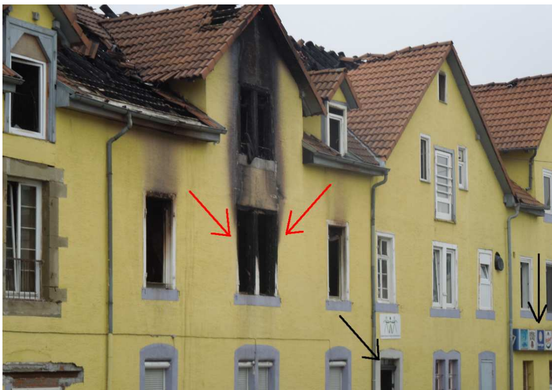
(Man sieht deutlich [rote Pfeile], wo das Feuer ausgebrochen sein muß. Der linke schwarze Pfeil zeigt den Eingang des deutsch-türkischen Vereins und wahrscheinlichen Hauseingang für die Wohnungen im ersten Stock an. Der rechte schwarze Pfeil zeigt auf den Getränkemarkt von Walter Schüle.)

Im Gespräch zeigte sich die ortsansässige Frau verwundert darüber, daß die Familienangehörigen – also Großmutter, Onkel und elfjähriger Junge – nicht versucht hatten, die Mutter mit ihren (z.T. kleinen) Kindern zu retten. Möglicherweise standen sie unter Schock bzw. war ein Eindringen in den verrauchten oder brennenden vorderen Wohnungsteil nicht mehr möglich.