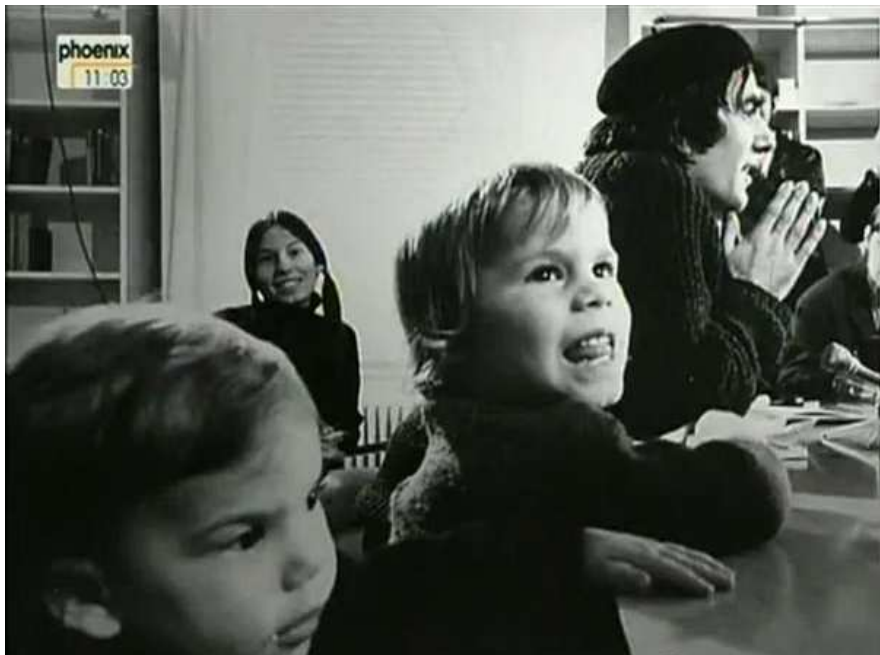
(Familie Dutschke in Aahus/Aldershvile)