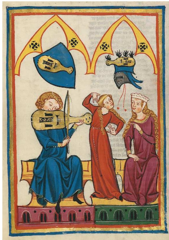
(Codex Manesse: Reinmar der Fiedler)

Es handelte sich damals um ein Streichinstrument, und dies wirft Fragen auf. Wie hat ein Sänger gleichzeitig ein geigenähnliches Instrument spielen können, besonders da er es nicht, wie heute, seitlich an den Hals gedrückt, sondern vor die Brust hielt, so daß der Körper des Instruments von vorne an den Hals gepreßt wurde? Es widerspricht allen physischen Regeln des Gesangs, da es den Atem behindert. Sollte man annehmen, der Troubadour- und Minnegesang habe auf Stimmstärke keinen entscheidenden Wert gelegt und sei eher dem wohlpointierten Sprechgesang ähnlich gewesen, wie er dem intimeren Rahmen einer kleinen Burrgesellschaft entsprochen habe? Andererseits hören wir aber von Auftritten der ritterlichen Musiker bei Turnieren und Festen im Freien, in denen ein solcher kammermusikalischer Vortrag kaum in Frage kommen konnte.