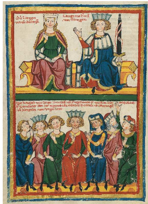
(Codex Manesse: Konradin der Jüngere 4 [li] und Sängerkrieg auf der Wartburg [re, vgl. Artikel 1198, S. 2/3])