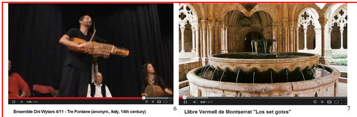
Ensemble Oni Wytars 4/11 - Tre Fontane (anonym., Italy, 14th century)

Von Richard I., König von England (1157-1199), wird ein historisches Erlebnis noch heute erzählt, das eng mit der Musik und dem Minnesängerwesen zusammenhängt. 1189 gekrönt und seiner Tapferkeit wegen bald mit dem Beinamen „lionheart“ (Löwenherz) bedacht, begab Richard sich mit der „Blüte der abendländischen Ritterschaft“ (wie es die Geschichtsbücher ausdrücken) auf den dritten Kreuzzug ins Heilige Land. Bei dem langen Heimritt durch den Balkan und die Donau aufwärts fiel er in die Hände seines Erzfeindes, des Herzogs Leopold V. von Österreich, der ihn in der Wachauer Festung Dürnstein gefangensetzte.