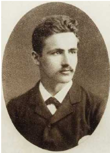
Frank Wedekind (1868-1918)

Nachtrag zu Alban Bergs Oper Lulu (siehe Artikel 1214, S. 4). Als Vorlage hierzu diente das gleichnamige Stück des deutschen Dramatikers Frank Wedekinds von 1913.