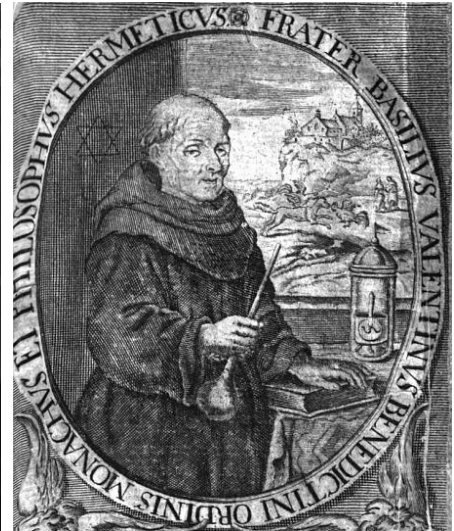
Basilus Valentinus (s.u.)

Über die vorige Inkarnation Frank Wedekinds sagte Rudolf Steiner 5 : Nun, da gibt es also im frühen Mittelalter diesen medizinischen, alchimistischen Basilus Valentinus , den Benediktinermönch, der sehr viel arbeitet in seinen Klosterkellern in Laboratorien, der eine Reihe von wichtigen Untersuchungen macht. Dann sind gewisse Menschen da, die sind seine Schüler, die schreiben bald nach ihm dasjenige nieder, was Basilus Valentinus ihnen gesagt hat. Und so gibt es eigentlich kaum echte Schriften von Basilus Valentinus; aber es gibt Schriften von Schülern, die sehr viel des Echten von seiner Weisheit, von seiner alchimistischen Weisheit bringen.