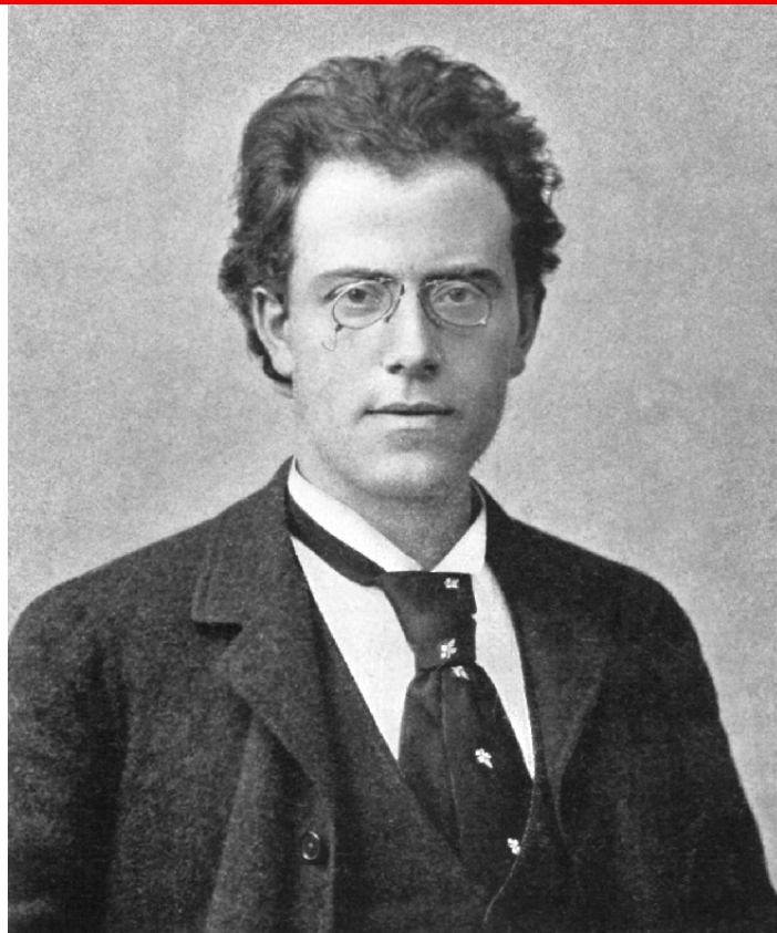
Gustav Mahler, 1892

Ich wiederhole nun die bisher gestellten Fragen zu Gustav Mahler (Artikel 1218-1230):