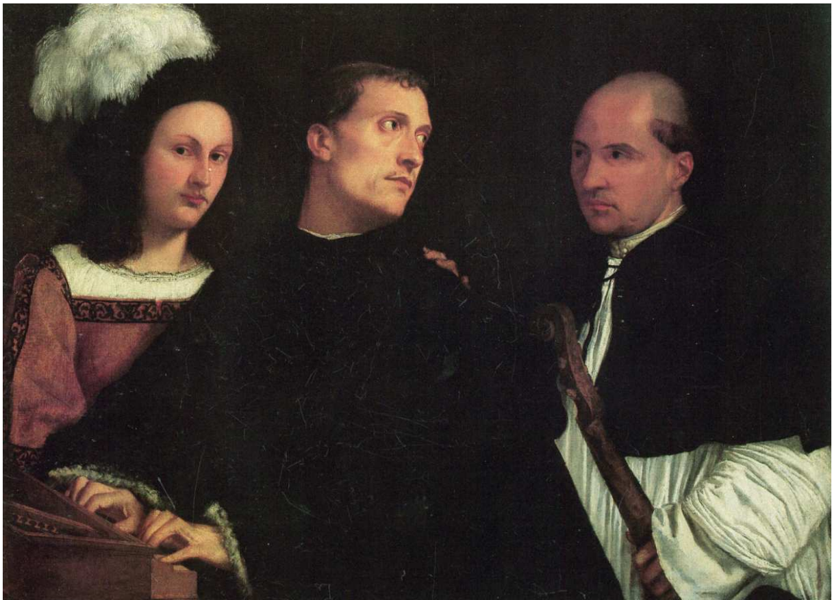
(Gustav Mahlers Lieblingsbild: Tizian, Das Konzert )

Es spricht viel dafür, daß Gustav Mahler langsam vergiftet wurde. Gleichwohl liegen die Geschehnisse mehr als hundert Jahre zurück und andere Optionen (wie ärztliches Versagen, Ignoranz, usw.) sollten in Erwägung gezogen werden. Die Zukunft wird die Wahrheit ans Licht bringen.