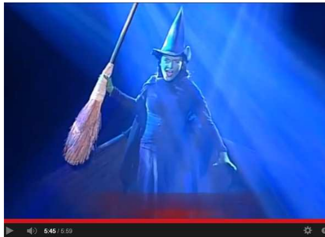
Ensemble des Musicals Wicked - Die Hexen von Oz 2008 10

Li: Titelblatt der englischen Originalausgabe von The Wonderful Wizard of Oz 11 , später The Wizard of Oz 12 aus dem Jahre 1900. Re: Video aus dem Musical Wicked – Die Hexen von Oz 13