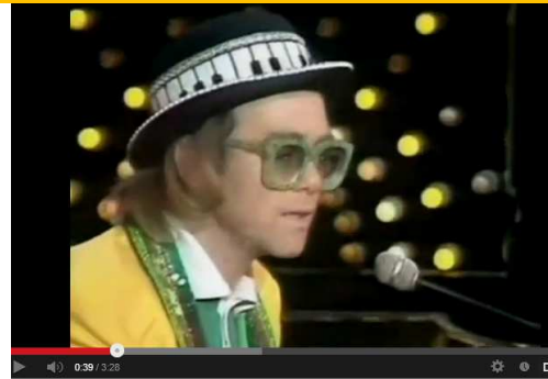
GOODBYE YELLOW BRICK ROAD / ELTON JOHN 18

U.a. Elton John und Eminem 19 thematisieren den „Weg aus gelben Backsteinen“ („ Yellow brick road “).