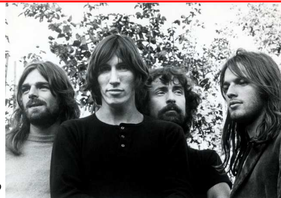
Pink Floyd - The Dark Side of the Moon: Us and Them (HD Mast... 9

Rechtes Bild: Pink Floyd , von links: Richard Wright (1943-2008), Roger Waters (*1943), Nick Mason (*1944), David Gilmour (*1946). Im obigen Song Us and Them klingt das Us wie Oz .