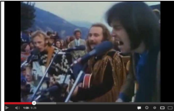
CSNY - Crosby, Stills, Nash & Young - Down By The River (Big ... 16

Der „Hippie“-CSNY-Song Down by the river , wo ein Mann seine Geliebte am Fluß ermordet, beinhaltet das „ Zauberer von Oz “-Thema „ Over the rainbow “. Darin heißt es u.a.: