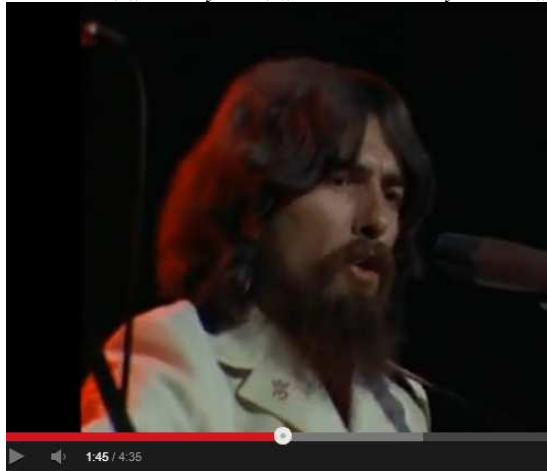
George Harrison My Sweet Lord