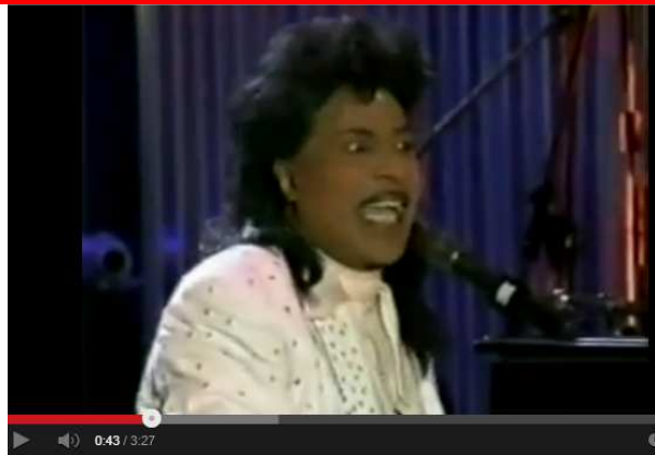
Little Richard - Tutti Frutti

1955 wendet sich ein junger Sänger ohne große Umschweife der praktischen Arbeit zu und stellt den neuen Musikstil live vor. Dieser junge Sänger ist Elvis Presley 10 der zum Symbol einer ganzen Jugend wird, die sich gegen alle Tabus und sexuellen Verbote eines puritanischen Amerikas auflehnt.