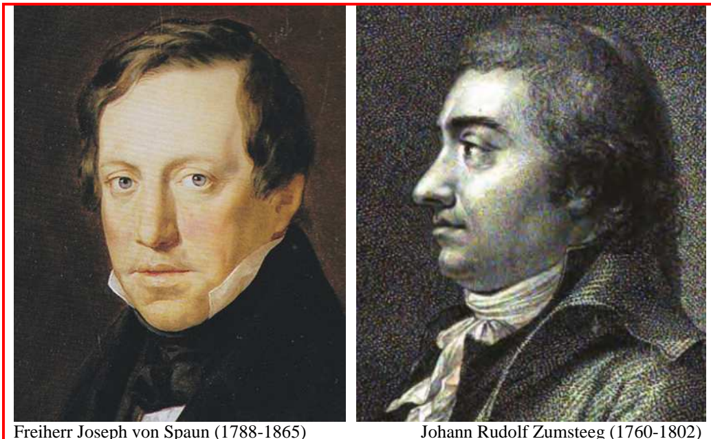
Freiherr Joseph von Spaun (1788-1865)

So greift er auch hier zum selbständigen Unterricht, zu einem Zeitpunkt, als sein theoretisches Studium noch keineswegs abgeschlossen war. Als Freiherr Joseph von Spaun (s.u.), kurze Zeit Konviktskamerad Schuberts, nach seiner Rückkehr nach Wien im Konvikt seinen Freund besuchte, fand er ihn beim eifrigen Studium des schwäbischen Lied- und Balladensängers Johann Rudolf Zumsteeg (s.u.). Schubert hatte mehrere Liederhefte dieses Komponisten vor sich und sagte, daß ihn diese Lieder zutiefst ergriffen; er könne in ihnen tagelang schwelgen.