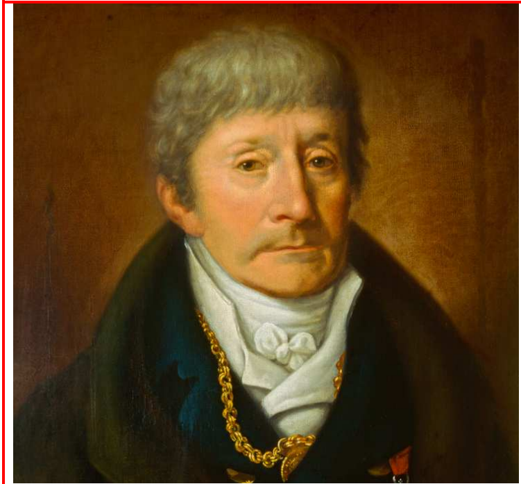
Antonio Salieri (1750-1825) war ein italienisch-österreichischer Komponist der Klassik, Kapellmeister und Musikpädagoge.

So greift er auch hier zum selbständigen Unterricht, zu einem Zeitpunkt, als sein theoretisches Studium noch keineswegs abgeschlossen war. Als Freiherr Joseph von Spaun (s.u.), kurze Zeit Konviktskamerad Schuberts, nach seiner Rückkehr nach Wien im Konvikt seinen Freund besuchte, fand er ihn beim eifrigen Studium des schwäbischen Lied- und Balladensängers Johann Rudolf Zumsteeg (s.u.). Schubert hatte mehrere Liederhefte dieses Komponisten vor sich und sagte, daß ihn diese Lieder zutiefst ergriffen; er könne in ihnen tagelang schwelgen.