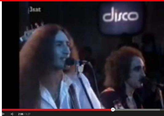
Uriah Heep-Lady in black 7

Die Gruppe „ Uriah Heep “ (s.u.) singt in einem ihrer Lieder über einen Dämon des Regenbogens, „welcher nur deine Seele will ...“ In der Bibel, Johannesevangelium, Kapitel VIII, Vers 44 , steht, daß der Teufel der Vater aller Lügen ist.