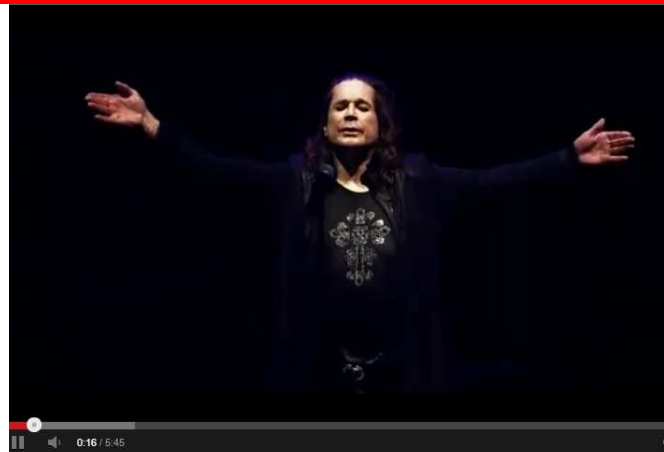
Ozzy Osbourne - Mr Crowley live at Ozzfest 2010 6

Die Gruppe „ Uriah Heep “ (s.u.) singt in einem ihrer Lieder über einen Dämon des Regenbogens, „welcher nur deine Seele will ...“ In der Bibel, Johannesevangelium, Kapitel VIII, Vers 44 , steht, daß der Teufel der Vater aller Lügen ist.