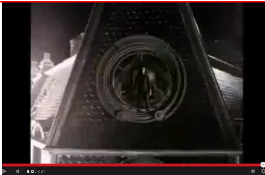
Black Sabbath - Born Again