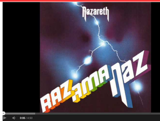
Nazareth-Sold My Soul

„Ich habe zu Gott gebetet, aber ich glaube, daß er mich nicht gehört hat. Mein Opfer war vergeblich, ich habe verzweifelt geweint, und ich habe an Schwarzer Magie teilgenommen. Ich habe durch die Tür des Himmels geschaut, aber ER muß gerade in eine andere Richtung geguckt haben. Ich habe aus Reue geweint, ich habe verzweifelt geweint und habe an Schwarzer Magie teilgenommen. Ich habe meine Seele dem Teufel verkauft. “