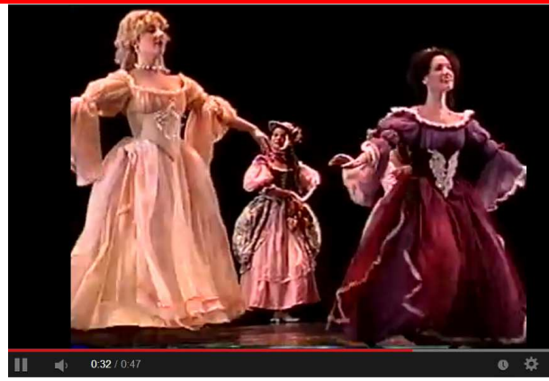
4 Baroque Dance: Gavotte from Atys