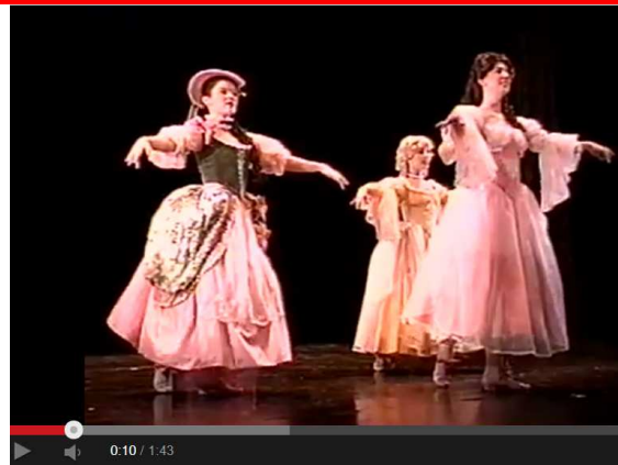
Baroque Dance: Trio Minuet

Kurt Pahlen schreibt über die Suite und Tänze 2 im Barock: 3 Die Suite ist älter als die Barockepoche. Aber gerade an ihr erweist sich die erneuernde Kraft des Barock . Sie macht endgültig aus einer Reihe einzelner, loser Tanzformen die kompositorisch größere, ein wenig anspruchsvollere Form der Suite. In ihr kann der Barock, seinem inneren Wesen gemäß, allerlei Kontraste miteinander vereinigen. Da stehen Hoftänze neben Volkstänzen, Deutsches neben Französischem, Englisch neben Spanischem und Italienischem. Alles findet Platz nebeneinander. Der Barock weiß den Reiz der Vielfalt, die Kraft der Gegensätze zu schätzen.