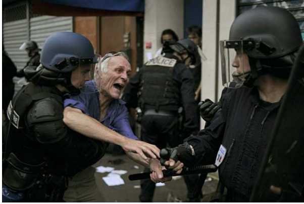
Paris, ca. 14. Juli 2009