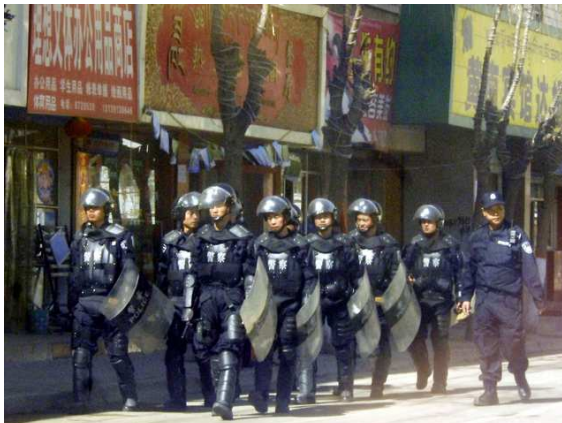
China, Juni/Juli 2009