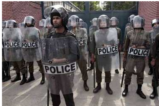
Iran, Teheran Juni 2009