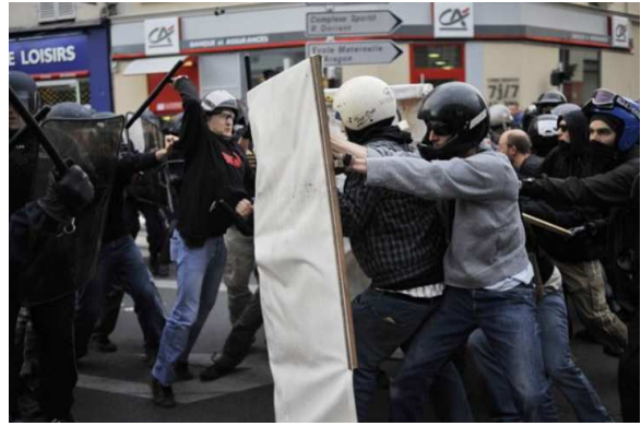
Paris, ca. 14. Juli 2009