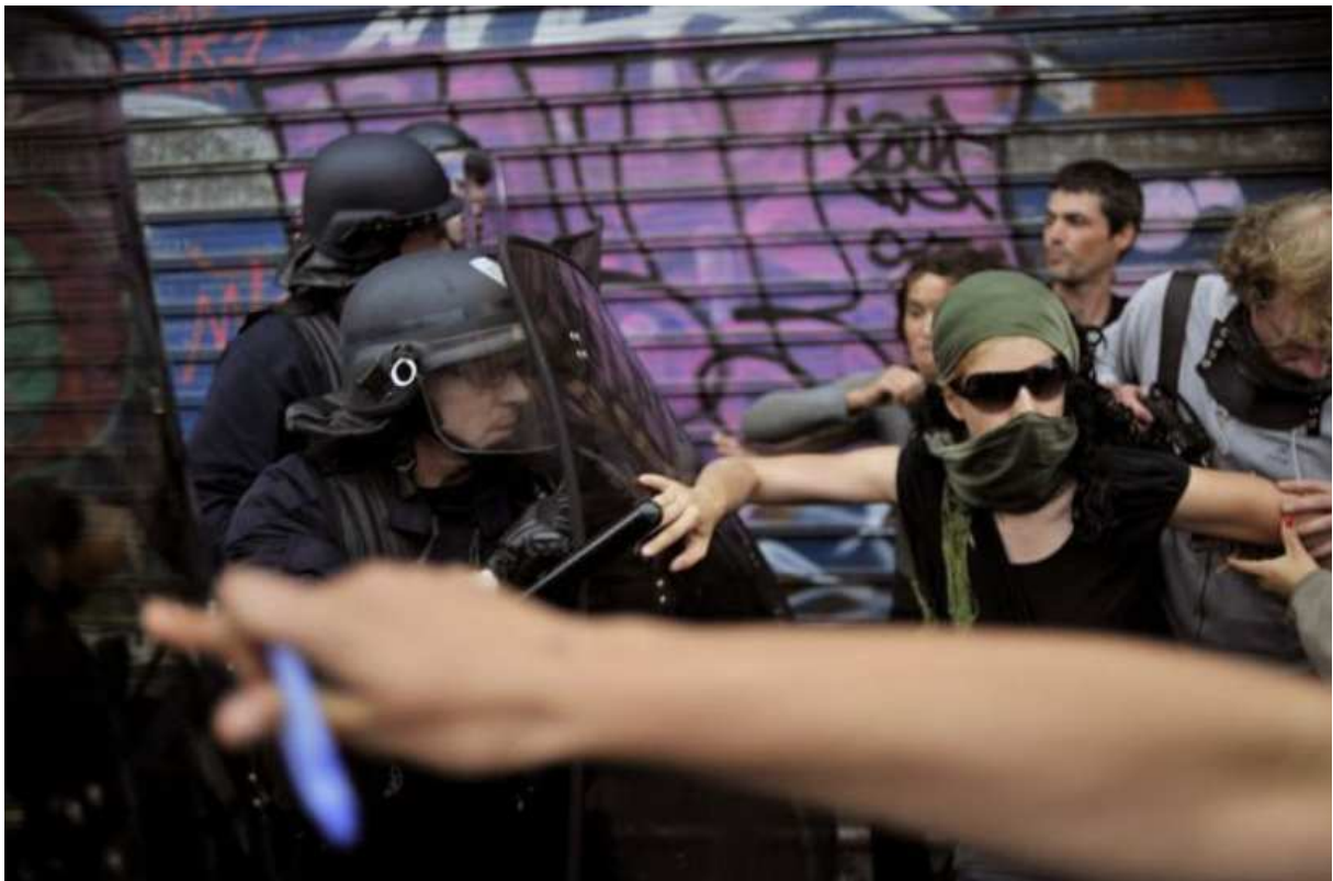
Paris, ca. 14. Juli 2009