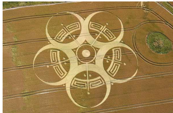
(Li: Gralsscheibe, Mexiko 1991. Re: Gralsmacht-Kornzeichen vom 25. 7. 2010, Roandway Hill, Wiltshire, GB)