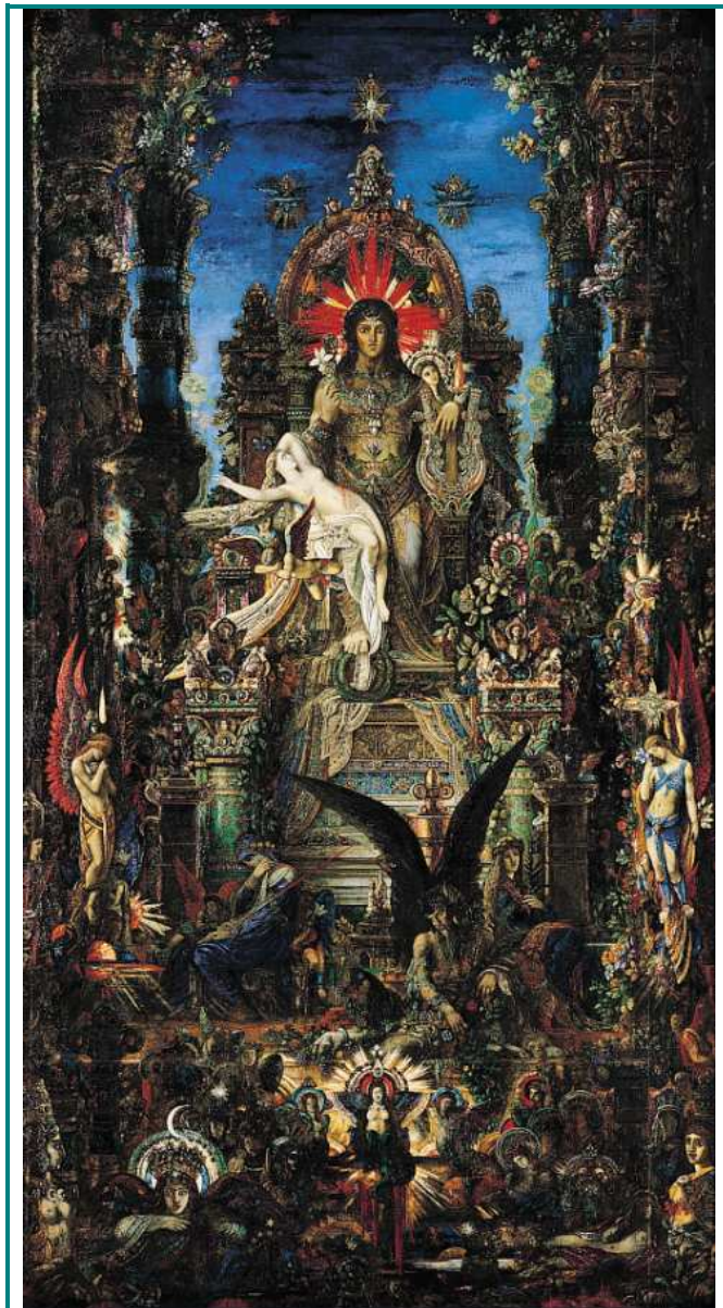
(Gustave Moreau [1826-1898], Jupiter und Semele oder: „ Zeus offenbart sich Semele “. Ausschnitt s.u.)

Nachdem ich ihn so als ein edles Gedicht des sehnsüchtigen menschlichen Verlangens ersehen hatte, das seinen Keim keineswegs nur im christlichen Übernatürlichkeitsdrange, sondern in der wahrhaftesten menschlichen Natur überhaupt hat, ward diese Gestalt mir immer vertrauter und der Drang, um der Kundgebung meines eigenen inneren Verlangens willen mich ihrer zu bemächtigen, immer stärker, so daß er zur Zeit der Vollendung meines Tannhäusers geradewegs zur heftig drängenden Not ward, die jeden anderen Versuch, mich ihrer Gewalt zu entziehen, gebieterisch von mir wies.» 12