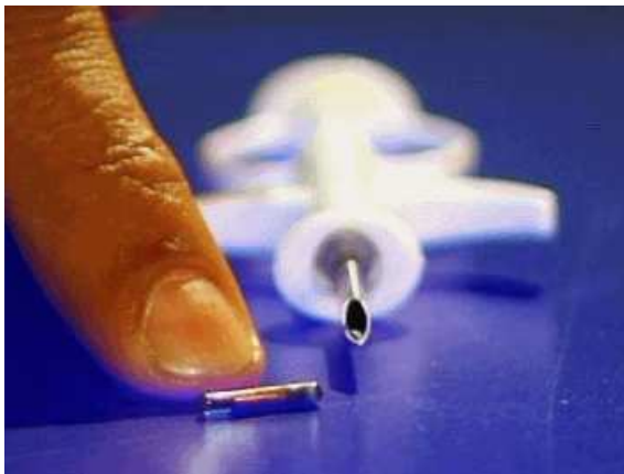
(RFID-Chip (sog. VeriChip von ADS in Reiskorngröße im Schutzbehälter) 5 )