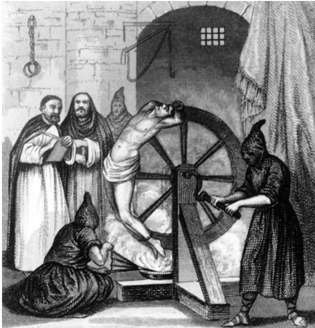
(Text 16 : Folterszene während der Spanischen Inquisition: Kuttentragende Sadisten oder Reformer?)

König Philipp II. übernahm die Herrschaft über die Niederlande 1555 von seinem Vater Karl V. Er setzte die bereits unter seinem Vater begonnenen Ketzerverfolgungen (Inquisition) , die schon Unruhen in den Niederlanden hervorgerufen hatten mit noch größerer Konsequenz fort. Im Jahre 1559 ernannte er im Zuge einer kirchlichen Reorganisation neue Bischöfe, die auch in den Generalständen der Provinzen, den so genannten Generalstaaten, vertreten sein sollten, und verkleinerte die Bistümer. Mit dieser Maßnahme wollte Philipp einerseits die Gegenreformation verschärfen , andererseits aber auch die ständischen Freiheiten, die den Provinzen im „Großen Privileg“ 1477 zugestanden worden waren, wieder rückgängig machen .