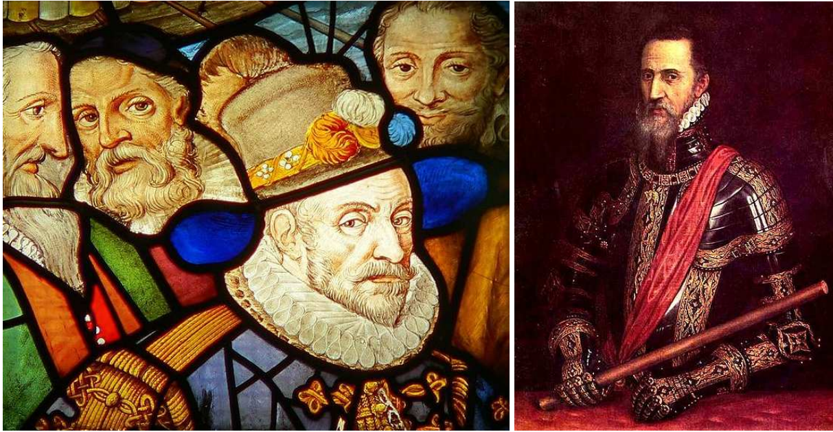
(Wilhelm I. von Oranien-Nassau im Glasfenster Nr. 25 in der Sint Janskerk in Gouda „Die Befreiung von Leiden“ 18 ) (Herzog von Alba, Fernando Alvarez de T.)

Mit seinen rücksichtslosen und willkürlichen Aktionen provozierte Alba jedoch neue Aufstände der Niederländer. Waren die Unruhen bis dahin meist regional begrenzt und noch größtenteils unkoordiniert, so erfasste der Aufstand nun das ganze Land.