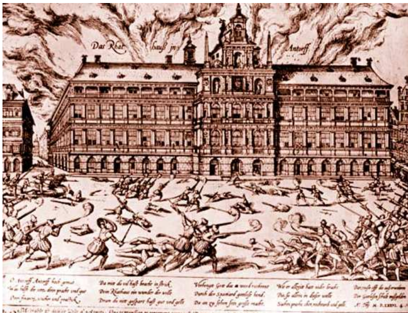
(Die Plünderung Antwerpens durch die spanischen Truppen 15 )

Um die Mitte des 16. Jahrhunderts verbreitete sich in den Niederlanden im Zuge der Reformation der Calvinismus . Die Niederlande stellten zur damaligen Zeit eine bedeutende wirtschaftliche Macht dar. Antwerpen war ein Zentrum des europäischen Kapitalmarktes . Durch ihre Häfen waren Antwerpen und Rotterdam außerdem bedeutende Umschlagplätze für den Handel mit Waren aus Übersee und den neuen Kolonien in Südamerika. Wegen dieser geballten wirtschaftlichen Macht und wegen der wichtigen strategischen Lage war Spanien nicht gewillt, die Niederlande aus seinem Besitz zu geben.