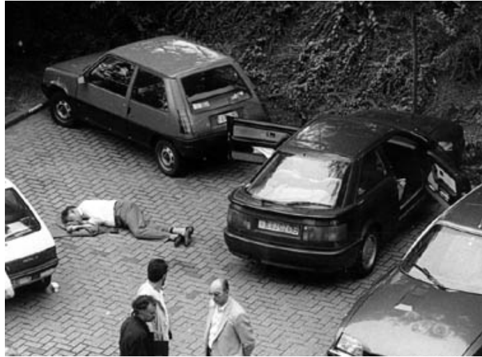
(Andre Cools` Ermordung: Der belgische Top-Politiker Andre Cools

wusste zu viel über die Verbindung von Top-US-Politikern zu den belgischen (pädokriminellen) Verbrechen und wurde [am 18. 14 7. 1991 15 ] in Lüttich ermordet. 16 )