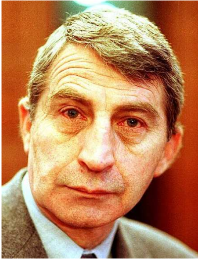
(Alain Van der Biest)

Nach Dutrouxs Entlassung bescheinigte ihm der Psychiater Emile Dumont aufgrund der Haft (!) eine seelische Schädigung mit resultierender Erwerbsunfähigkeit auf Lebenszeit, deretwegen er eine staatliche Rente bekam, und verschrieb ihm Schlafmittel und Sedativa, die er später zur Betäubung und Ermordung seiner Opfer einsetzte.