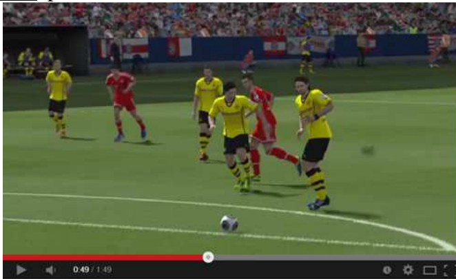
FIFA 14 - Test / Review (Gameplay) zur PlayStation 4 / Xbox One-