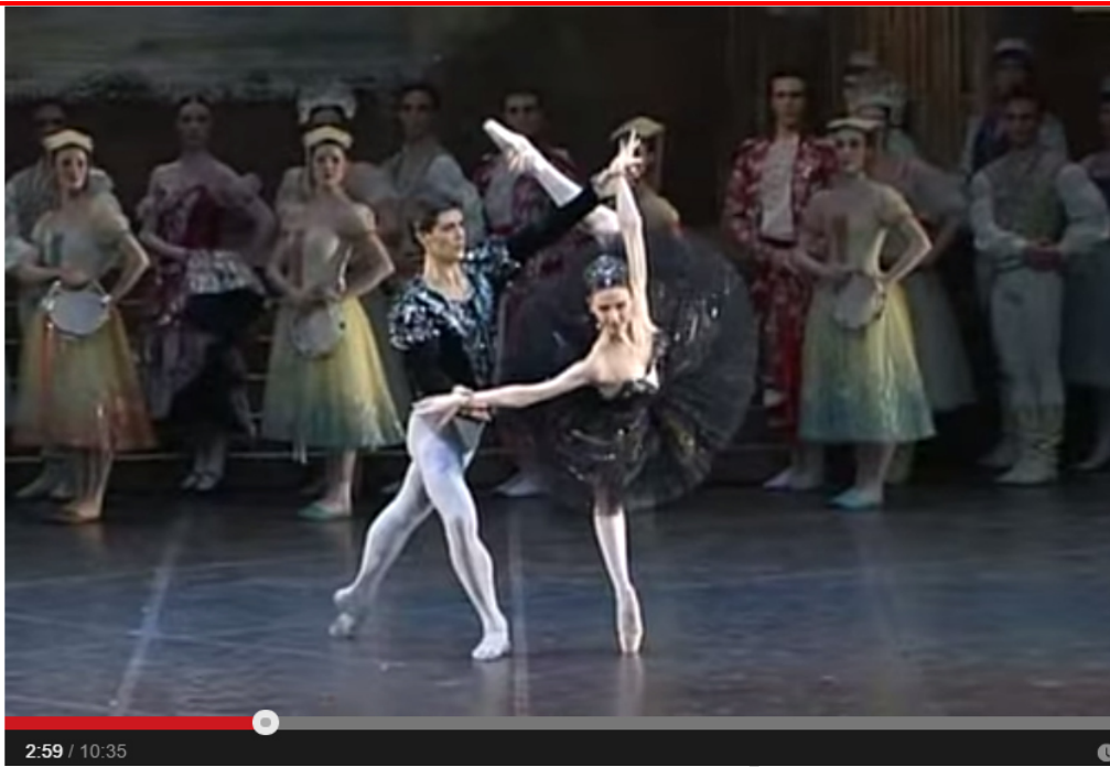
Svetlana Zakharova and Roberto Bolle@Swan Lake 7

Über sein Violinkonzert 6 hatte er geschrieben, es läge der Verdacht nahe, daß es „stinkende Musik“ gäbe. Wie viele große Geiger spielten nun gerade dieses Werk überall in der Welt! Kaum eine Tanzgruppe konnte an seinen abendfüllenden Balletten vorübergehen, die zu Lieblingsstücken des Publikums geworden waren: „ Schwanensee “ (s.u.), „ Dornröschen “, „ Der Nußknacker “. Erfolgreich hatte er auch zur Form der Orchesterfantasie , des sinfonischen Gedichts gegriffen: „ Francesca da Rimini “ (1874, nach Dante), „ Italienisches Capriccio “ (1880, ein wirkungsvolles, wenn auch recht äußerliches Ansichtskarten-Italien), der russische Freiheitsgesang „1812“, der Napoleons Armee vor den Toren des brennenden Moskau und unter dem jubelnden Klang von Glocken und hymnischen Gesängen untergehen läßt (1880, als „lärmendes“ Gelegenheitswerk, wie er selbst sagt, zu einem patriotischen Fest), „ Manfred “ (1885, nach Lord Byron) und, als wohl schönstes, „ Romeo und Julia “ (letzte Fassung 1880, nach Shakespeare).