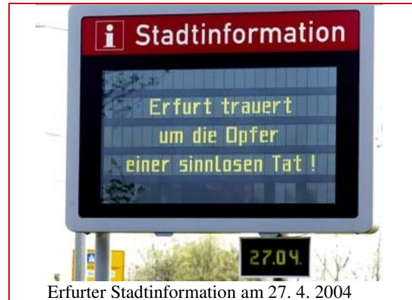
Erfurter Stadtinformation am 27. 4. 2004