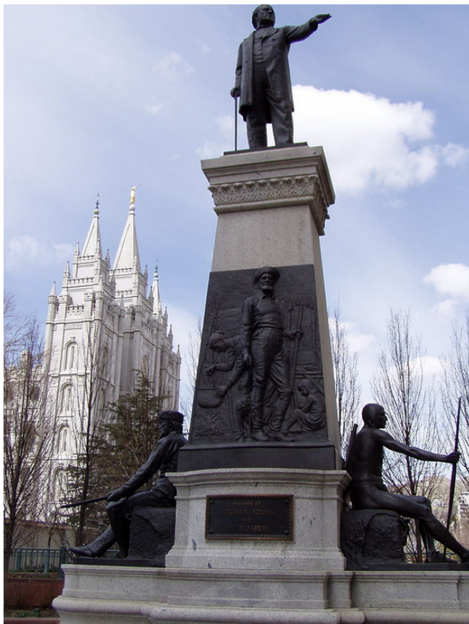
Monument zur Ehrung von Brigham Young in Salt Lake City. 1 Dahinter befindet sich der Salt-Lake-Tempel der Mormonen.

Johann Sebastian Bach: "Guter Hirte, Trost der Deinen", BWV 184 (SE-43): S. 4