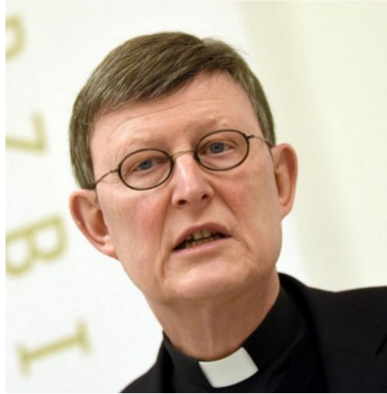
(Der Kölner Kardinal Woelki hat eine gesamteuropäische Lösung der Flüchtlingskrise gefordert. 21 )