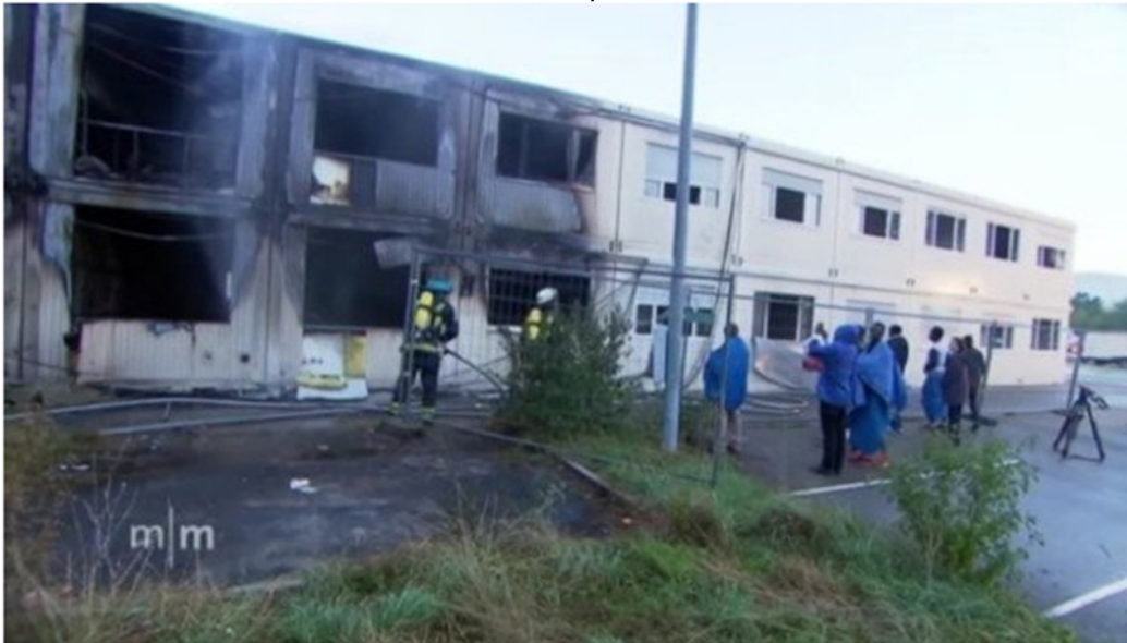
Brand im Asylbewerberheim in Rottenburg bei Tübingen.