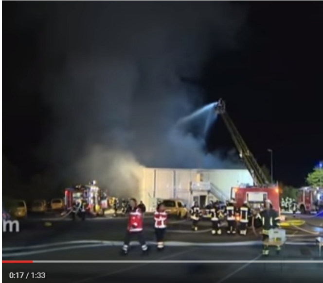
Brand in Asylbewerberheim: Fremdenfeindlicher Hintergrund kann nicht ausgeschlossen werden 17

Denn: Wie kann man eindringlicher vor den "bösen Rechtsradikalen" warnen, als mit Bildern von brennenden Asylheimen? 18