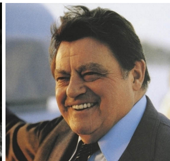
Franz Josef Strauß Kanzler für Frieden und Freiheit