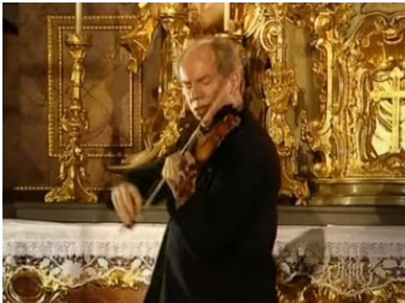
Bach, Partita Nr 1 h Moll BWV 1002 Gidon Kremer Violine) 18

Ein weiteres "Schlüsselerlebnis" (SE-208) in der Ausnahmemusik Johann Sebastian Bachs ist: Violin-Partita Nr.1 in h-Moll, BWV 1002.