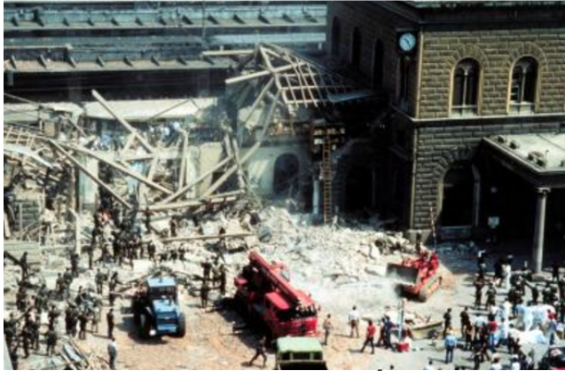
Zerstörter Hauptbahnhof von Bologna. 5

Die Merkmale der Gladio-Strategie der Spannung waren in der damaligen Zeit Bombenanschläge . 55 Tage vor der Oktoberfest-Bombe erfolgte der Gladio-Terroranschlag von Bologna (2. 8. 1980, s.li.), wo 85 Menschen starben und über 200 Personen verletzt wurden. 6 Zunächst wurden die linksextremen Roten Brigaden beschuldigt, den Anschlag begangen zu haben. 7