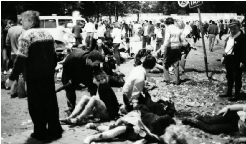
(Nach dem Gladio -Terroranschlag , 26. 9. 1980 2 )