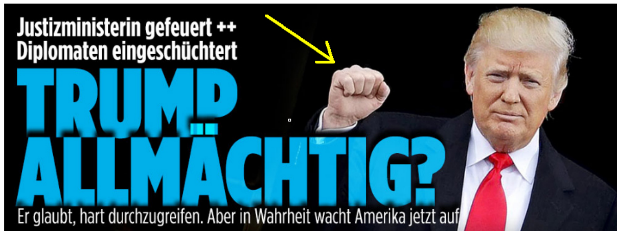
(Bild.de, 31. 1. 2017, 14:55: Man achte auf die geballte Faust – eine Kommunistenfaust?)

Natürlich wird Trumps Einreiseverbot (als Reaktion) der Migrations-Agenda und dem Linksstaat "Auftrieb geben".