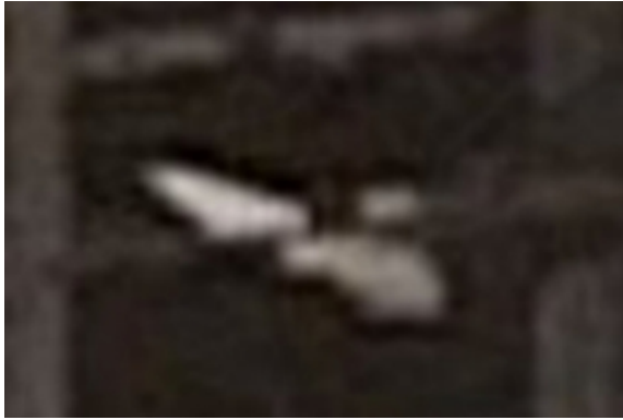
(Messer in der rechten Hand)