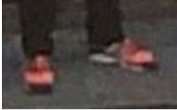
(Rötlicher Überzug über seinen Schuhen)

Was wollte der "Amokfahrer" mit dem Messer? Es wird nichts davon berichtet, daß er damit Passanten bedroht oder angegangen hätte.