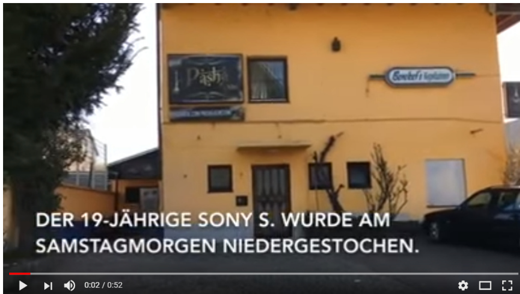
Konstanz: Schweizer vor Shisha-Bar von Syrer erstochen? 12

Ich komme auf den Shisha-Bar-Mord vom 11. 3. 2017 in der Nähe von der Grey-Diskotheek zurück. 11