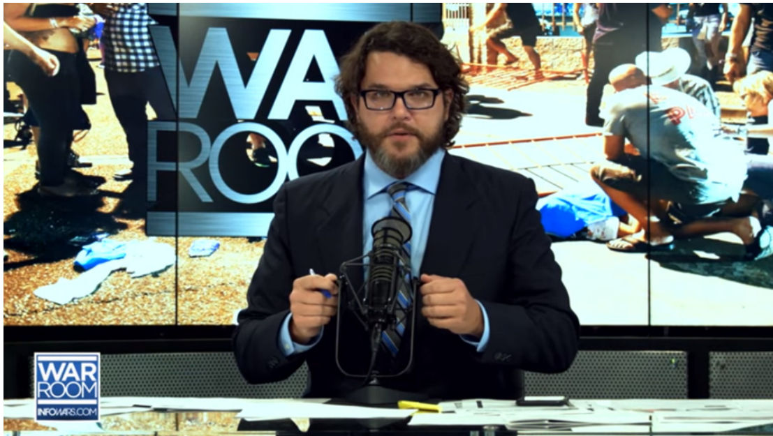
Did Vegas Shooter Act Alone? Witnesses Say They Saw Multiple Shooters 4

Andere Videos bringen Augenzeugen, die von mehreren Attentätern sprechen, wie z.B.: