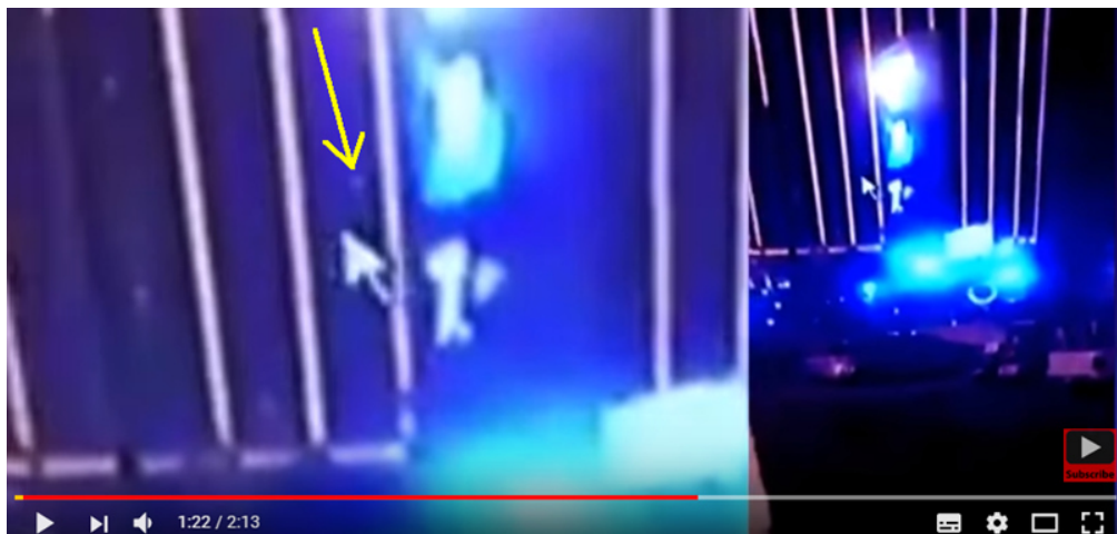
Proof Las Vegas Shooting Was a FALSE FLAG Attack - Shooter on 4th Floor 3

Nun gibt es aber Videoaufnahmen (ab 1:21 bis 1:52), die Mündungsfeuer (– dieses entspricht durchaus den Geräuschen der MG-Salven 2 –) aus dem 4. Stockwerk belegen: