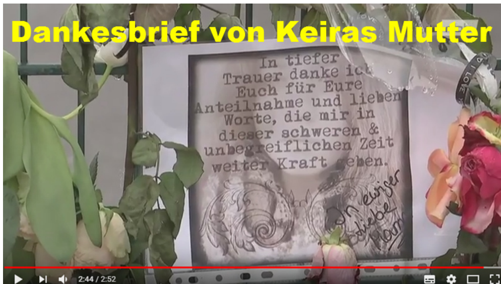
Jugendlicher gesteht Mord an 14 jähriger Keira 7