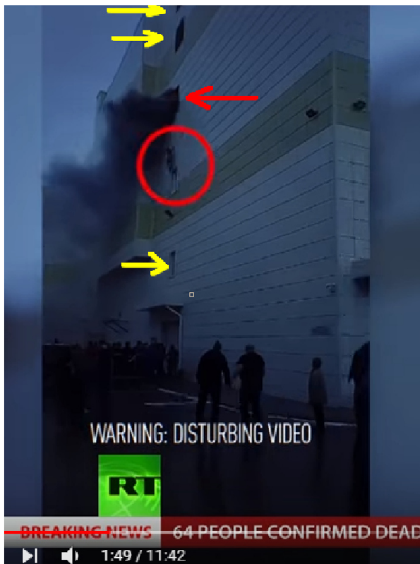
Kemerovo Fire: 64 dead, bodies remain trapped under rubble after shopping mall blaze 1

Betrachtet man das Bild links, dann fällt folgendes auf: nur aus dem 4. Stockwerk kommt Rauch. Aus diesem Stockwerk springt eine Person (Kreis) in die Tiefe. Unten sind aber keine Feuerwehrleute mit Sprungtüchern (o.ä.), die sie hätten auffangen können. Warum nicht? Diese Person wurde schwer verletzt, andere starben beim Sprung aus dem Fenster (s.u.). In dem Video (s.li.) wird zudem aufgezeigt, daß das Inferno im Kinderspielbereich ausbrach: 2