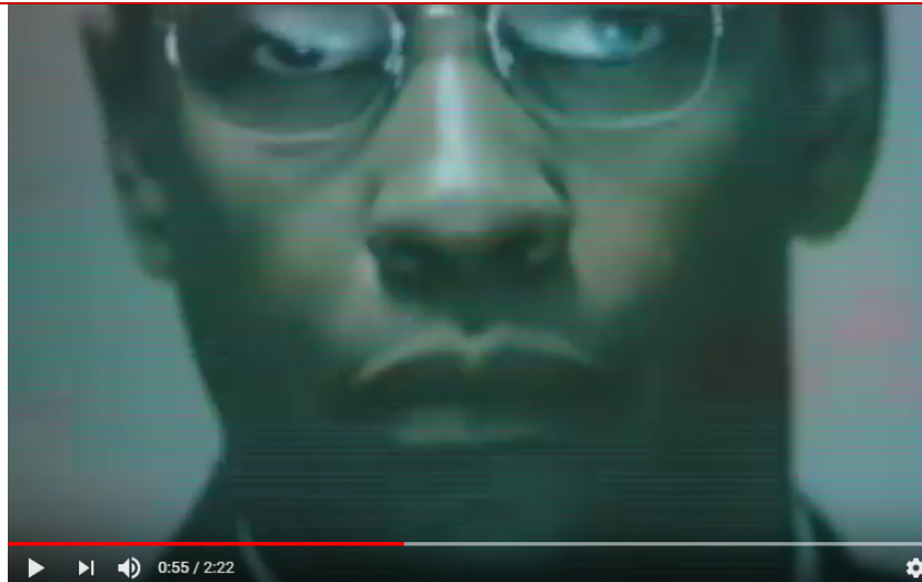
der manchurian kandidat trailer 1 German 24