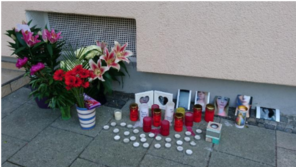
(Freunde der Toten stellten Kerzen, Fotos und Blumen auf. 10 )

Aber: Der 19-Jährige ist in München gemeldet, wohnte nach tz-Informationen weniger als zwei Kilometer vom Tatort ebenfalls in Neuhausen . 7 Das heißt: er müßte 24-30 Minuten 8 verletzt und in blutverschmierten Kleidung 9 durch die Stadt gelaufen sein, ohne daß es jemand aufgefallen wäre. Kann das sein? Zumindest den ... zwei Personen müßte es aufgefallen sein.