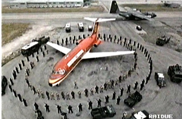
Die Pattsituation zwischen US-amerikanischen und italienischen Behörden auf der NATO-Basis Sigonella 11

fens von Rom vereitelten Raketenanschlag auf das Regierungsflugzeug der israelischen Ministerpräsidentin Golda Meir, 1972, verhaften konnte, dann jedoch ohne Gerichtsverfah- ren nach Libyen entkommen ließ. 12