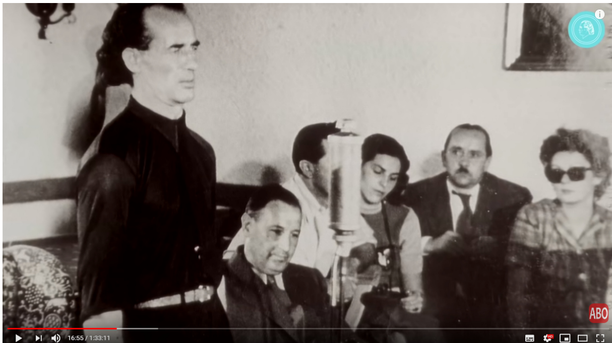
Das Phänomen Bruno Gröning - Dokumentarfilm - TEIL 2 1

Ab 16:54 (bis 20:32) heißt es: Bruno Gröning spricht auch in Radiosendungen zu den Menschen, wodurch ebenfalls Fernheilungen geschehen.