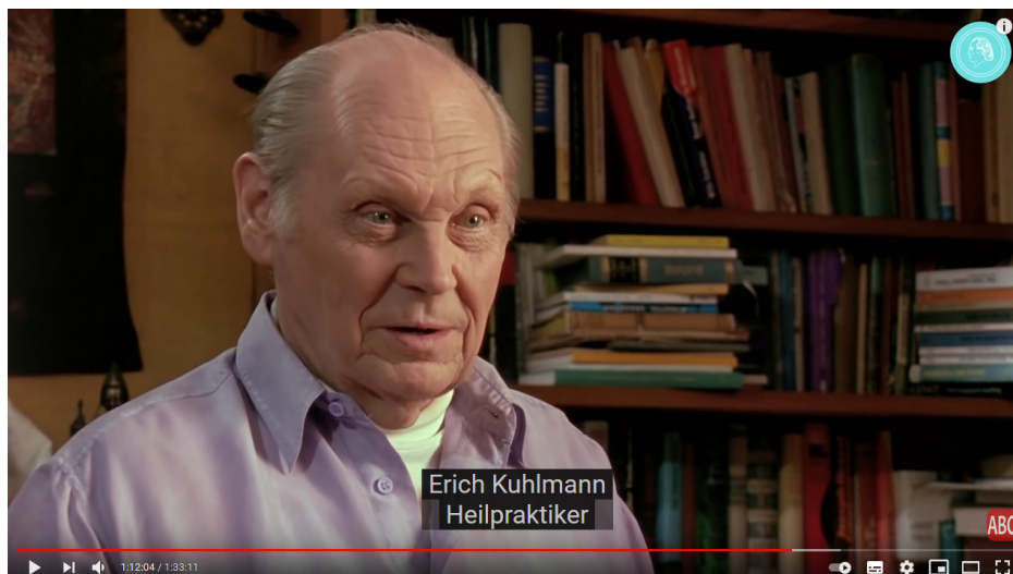
Das Phänomen Bruno Gröning - Dokumentarfilm - TEIL 2 3

Ich fahre mit der Biographie Bruno Grönings 2 fort (ab 1:12:04): Erich Kuhlmann: Was bei