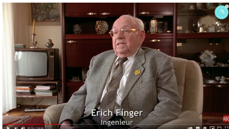
Das Phänomen Bruno Gröning - Dokumentarfilm - TEIL 3 2

Ich fahre mit der Biographie Bruno Grönings 1 fort (ab 21:15): Erich Finger :