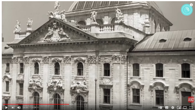
Das Phänomen Bruno Gröning - Dokumentarfilm - TEIL 3 2

Am 4. März 1955 erhebt die Staatsanwältin München erneut Anklage gegen Bruno Gröning wegen Verstoß gegen das Heilpraktikergesetz.